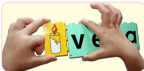
Unión de las fichas encajables

Con sus fichas se trabaja también la destreza manual